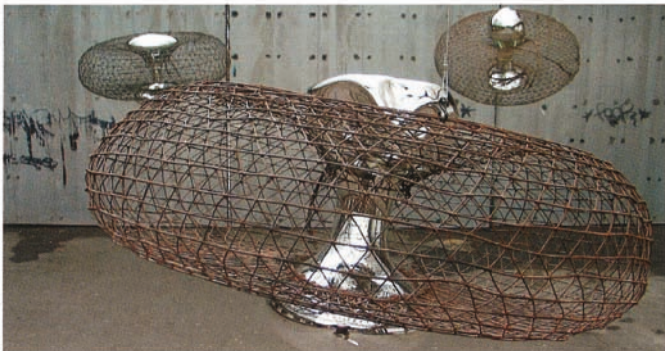
Klaus Hilsbecher: Murjonas – Installation

In einer Zeit wo Rohstoffe und Nahrungsmittel (Überfischung, Verschmutzung der Weltmeere) knapp werden, möchte Klaus U. Hilsbecher