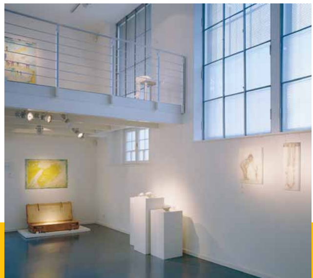
Blick in den unteren Atelierraum, Foto: © Alexander Tutsek-Stiftung, München

The quest for the far-off, the other, freedom, truth, new or strong feelings, transcendental moments as well as luck are the essential emotions but also motifs that determine life, our life's journey. They are the outstanding motivating forces for the spiritual, intellectual, and technical development of humankind.