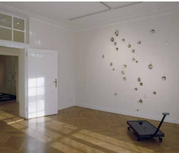
Sybille Peretti: Wall of Tears , 2006/2007, geblasenes Glas, graviert, Wasser, Transparentfolien, blown glass, engraved, water, transparent sheets (L) 220 x (H) 300 x (T) 9 cm