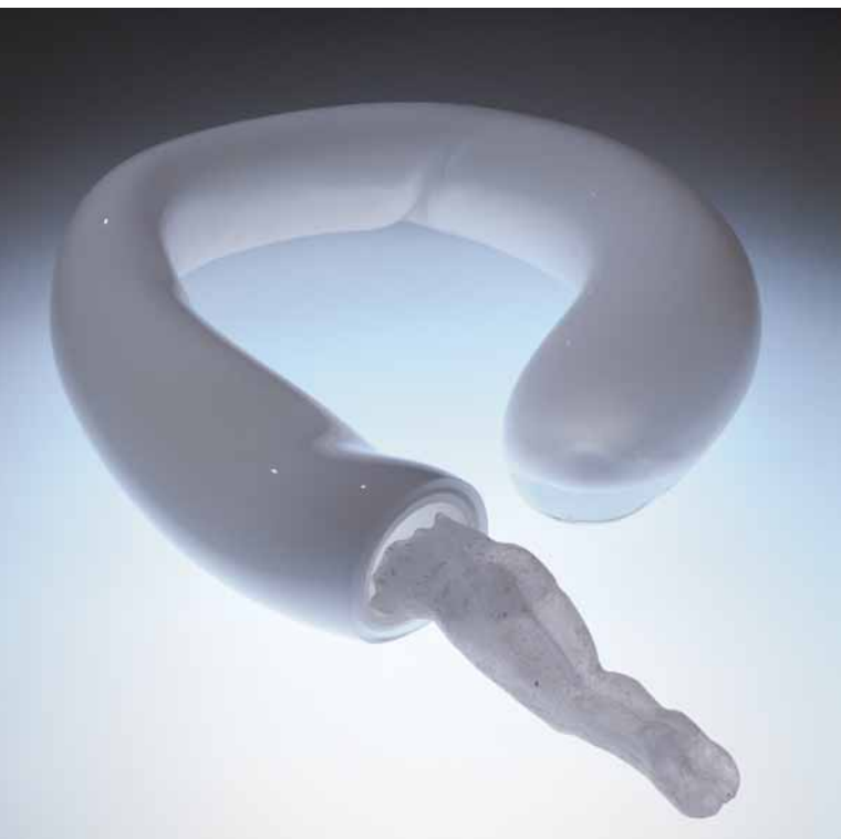
Christiane Budig: Eigenwelt I, 2005, weißes Überfangglas geblasen, Glas in Form geschmolzen, white overlay glass blown, mold-melted glass, (L) 43 x (B) 55 x (H) 10 cm, Foto: © Alexander Tutsek-Stiftung, München

temporary art trends as much as possible. That is indispensable for my work. Aside from what is being shown in Munich, I always take the time when I travel to look at the current art scene of the city or country I am in, recently, for example, in China and Vietnam. It is important not to be caught up in a medium such as glass but to know and analyze many directions and developments in contemporary art. That is a framework within which you can position works of glass, and which provides a direction when purchasing art.