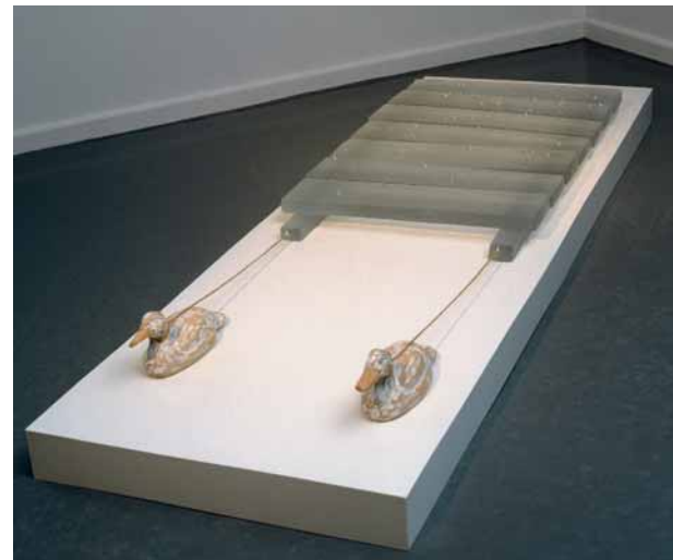
Jens Gussek: Shipping my Tears , 2007, formgeschmolzenes Glas, Holz, mold-melted glass, wood, (L) 178 x (B) 50 x (H) 8 cm, Foto: © Alexander Tutsek-Stiftung, München

Mit thematischen Ausstellungen möchte ich Impulse geben. Ausstellungen mit zeitgenössischer Kunst müssen berühren, gedanklich etwas bewegen, ansonsten bleiben sie im kunsthistorischen musealen Zeigen und Dokumentieren verhaftet. Glas ist heute längst über den Punkt hinaus, dass einfach nur interessante Objekte ausgestellt werden. Das entspricht nicht mehr dem Selbstverständnis der Künstler und unterfordert die an Kunst interessierten Besucher. Wenn Glas sich mit der anderen zeitgenössischen Kunst messen will, müssen die Kunstwerke in den entsprechenden Ausstellungen gezeigt werden.