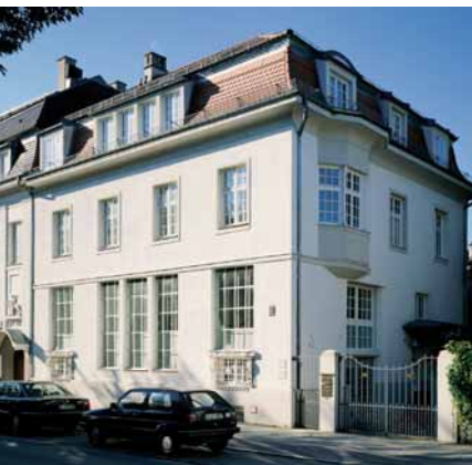
Alexander Tutsek-Stiftung, München, Foto: © Alexander Tutsek-Stiftung, München

Sculptures by Christiane Budig, Jens Gussek, Ursula Huth and Sibylle Peretti