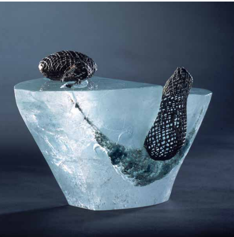
Ursula Huth: Cargoes-tschallo 2 (4-teiliges Kunstwerk), 1994/2005, Pâte de verre, Messingguss, (L) 36 x (B) 24 x (H) 33 cm