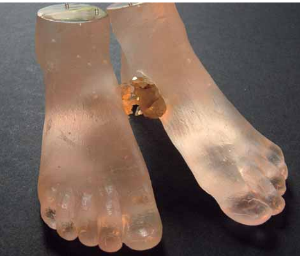
Sibylle Peretti: Kinderfüße , 2007, Detail, ofengeschmolzenes Glas, eingelassener Kristall, (L) 17 x (B) 7 x (H) 9 cm, Foto: © Alexander Tutsek-Stiftung, München