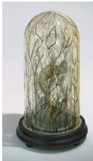
Sibylle Peretti: Junge mit Kristall , 2007, (H) 32, (D) 18 cm, graviertes, bemaltes Glas, Kristall, engraved, painted glass, crystal