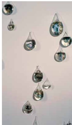
Sybille Peretti: Wall of Tears , 2007, Detail, Foto: © Alexander Tutsek-Stiftung, München