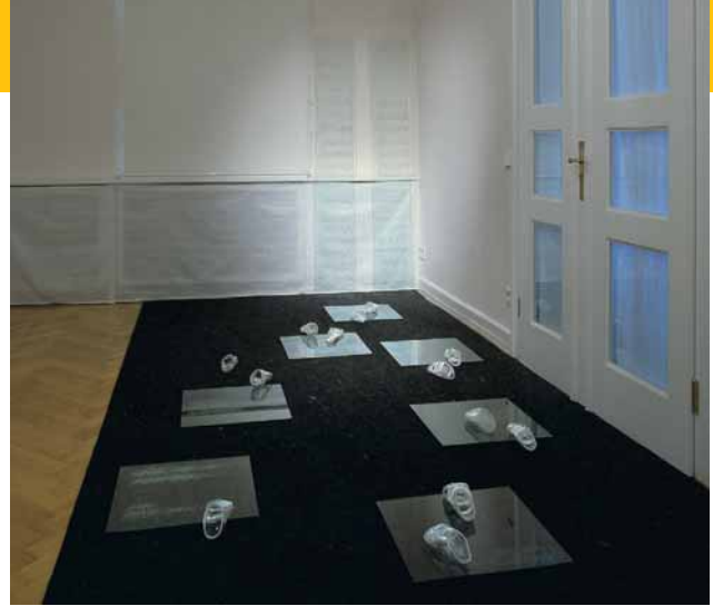
Christiane Budig: HaltLos, 2006/2007, geblasenes Glas, graviertes Floatglas, Seidenband, blown glass, engraved float glass, silk ribbon, (L) 400 x (B) 200 x (H) 198 cm

EMFT Ein Thema stellt Anforderungen. An die Künstlerinnen und Künstler und die Besucher, aber auch an die Kuratoren. Die theoretische wie emotionale Auseinandersetzung mit einer speziellen Thematik ist ein kreativer Teil meiner Arbeit, den ich nicht missen möchte. Das gibt der Ausstellung ihre Besonderheit und ihre Individualität.