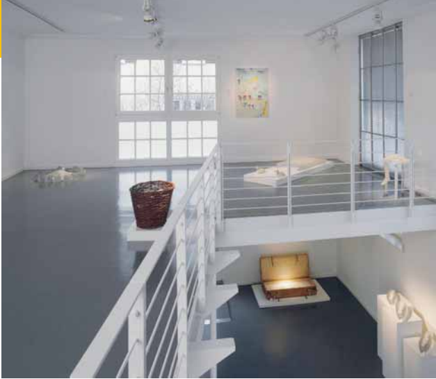
Blick auf die Galerie

dium – dem Wort – zu kommunizieren. Das Zitat von Goethe „Und immer sehnt sich fort das Herz“ drückt Suche und Sehnsucht des Menschen sehr poetisch aus und fiel mir auf, als ich Goethes West-östlichen Diwan wieder einmal zur Hand nahm. Damit war der Titel der Ausstellung geboren. Mit dem Thema möchte ich auch auf eine Ausstellung mit deutschen Künstlerinnen und Künstlern einstimmen. Bisher waren alle Ausstellungen der Stiftung international besetzt. So finde ich es nur richtig, einen unserer größten deutschen Literaten sozusagen als Pate für diese Ausstellung zu nehmen.