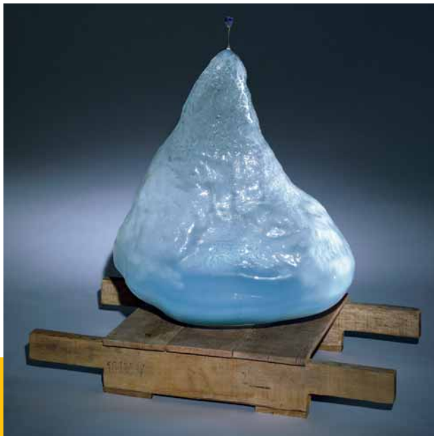
Jens Gussek: The Blue Flower , 2007, geblasenes Glas, Holz, blown glass, wood, (L) 68 x (B) 34 x (H) 74 cm, Foto: © Alexander Tutsek-Stiftung, München

EMFT Mir geht es in erster Linie darum, das beschriebene Ausstellungskonzept fortzusetzen, auszubauen und dieses Niveau zu halten. Ein Schwerpunkt wird neben unserem zweiten Stiftungszweck der Forschungsförderung die Förderung von interessanten Künstlerprojekten bleiben. Mein Wunsch ist, dass die Alexander Tutsek-Stiftung zu einer festen Größe für alle Kunstinteressierten wird.