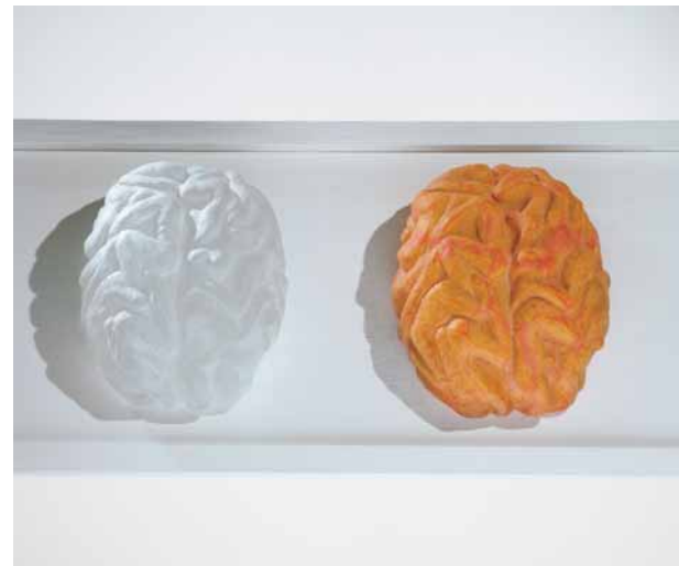
Christiane Budig: 2006/2007, Simple thinking oder einfach glücklich , (L) 54 x (B) 24 x (H) 7 cm, formgeschmolzenes Glas, Holztablett, mold-melted glass, wooden tray, Foto: © Alexander Tutsek-Stiftung, München

Installation, und worin liegt die Bedeutung?